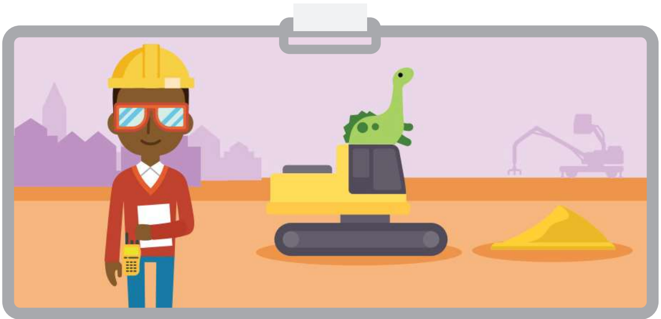
Illustration de l'élève n° 1 :

Illustre un professionnel en milieu de travail et décris certaines caractéristiques de sa profession.